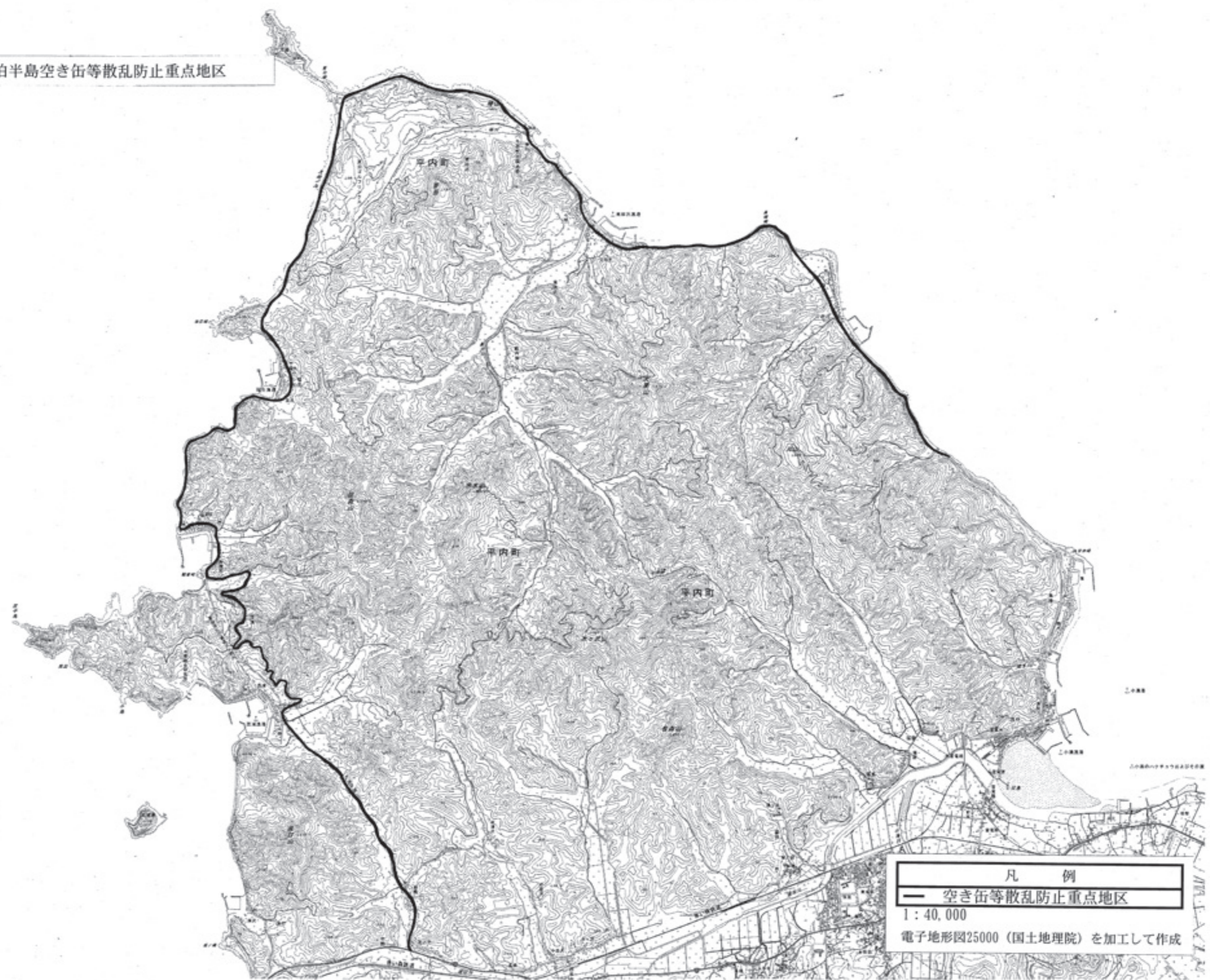
別図15 夏泊半島空き缶等散乱防止重点地区