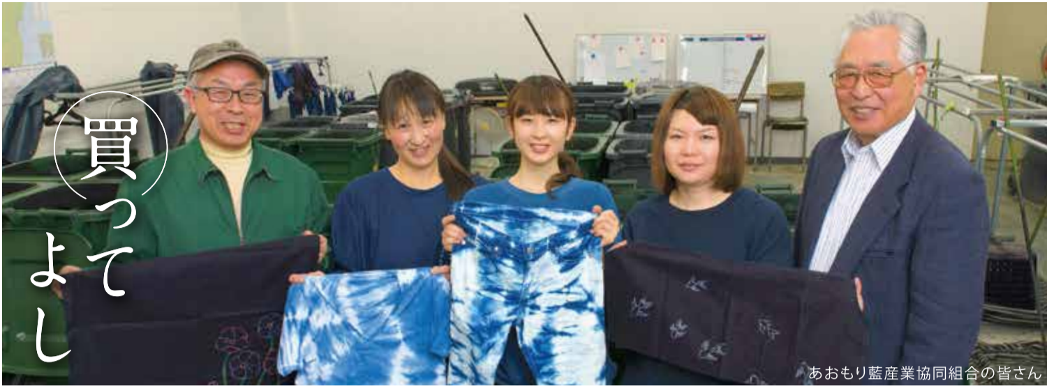
あおもり藍産業協同組合の皆さん