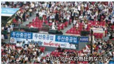
斗山ベアーズの熱狂的なファン