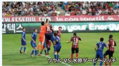
ソウル VS 水原ダービーマッチ

ソウルでは、このように、青森県内ではなかなか見ることができないプロスポーツを、安く、簡単に見ることができます。さらに、今年は9月にアジア地域のオリンピックであるアジア競技大会が仁川(インチョン)市で開幕します。今年の夏はソウルでスポーツ観戦はいかがでしょうか。それでは、次回までアンニョンハセヨ(お元気で)！