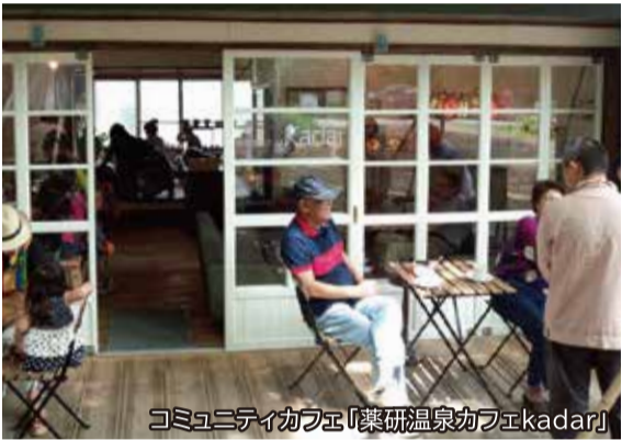
コミュニティカフェ「葉研温泉カフェekadar」

私たちが運営しているコミュニティカフェ「葉研温泉カフェekadar(カダール)」は、葉研温泉郷にあった空き店舗を改装したものです。そこはかつて、おでんを店内で食べられるような酒店で、地域の交流の場でした。メンバーから「ここでカフェやりたくない？」という声が上がリ、交流の拠点としての