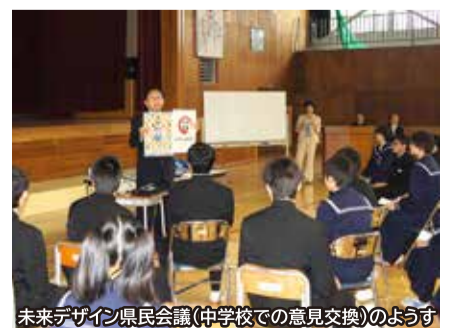
未来デザイン県民会議(中学校での意見交換)のようす