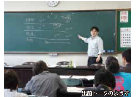
出前トークのようす