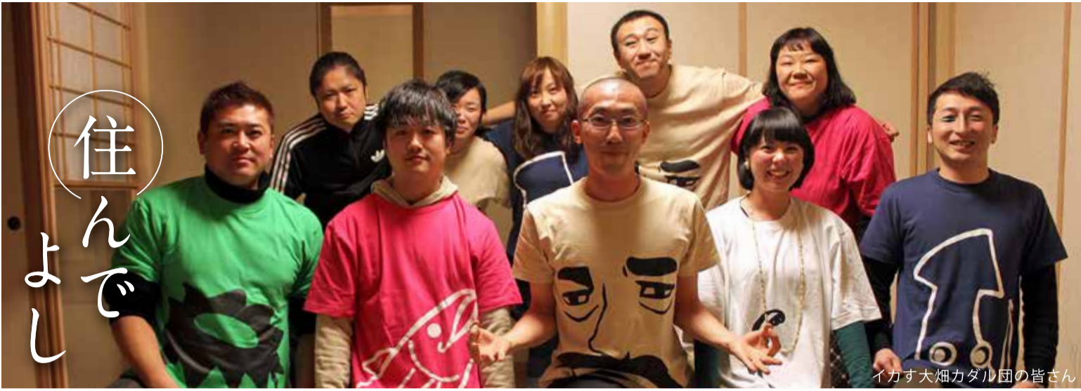
イカす大畑カタル団の皆さん

はじまりは、2011年。東京からUターンしてきた際、地域の人口も減り、商店街はシャッターが閉まり、街全体に元気がないと感じました。東京の広告業界で働いていた経験を生かし、若い世代にも地元の魅力を感じてもらえる仕掛けづくりができたなら…。