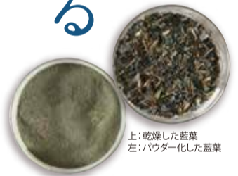
上:乾燥した藍葉 左:パウダー化した藍葉