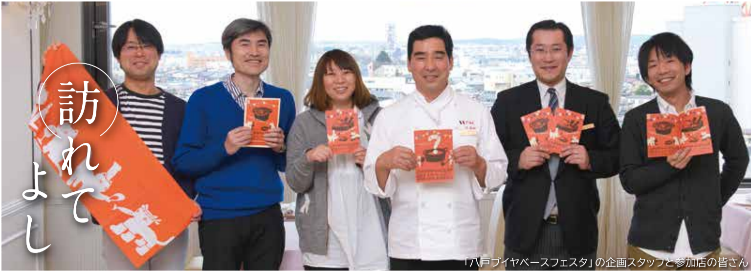
「八戸バイヤースフェスタ」の企画スタッフと参加店の皆さん