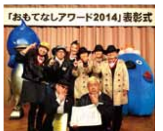
おもてなしアワード2014 知事賞を受賞した「弘前路地裏探偵団」の皆さん

詳しくは、県庁HP おもてなしアワード2015 観光企画課 ☎017-734-9385