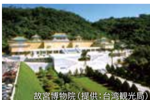
故宮博物院

旅行コースは、台北を起点に人気名所をめぐる「台北満喫プラン」や、台北・高雄の2大都市を周遊できる「台湾2大都市めぐりプラン」などバラエティに