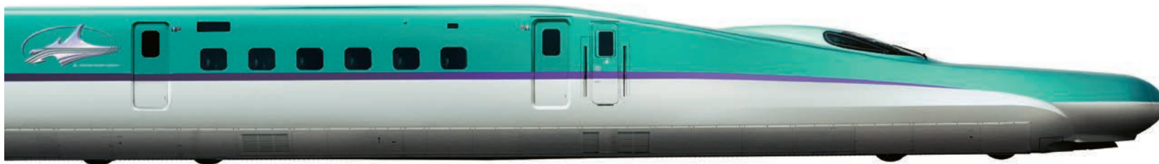
JR北海道 H5系

【ホーム】 柱の数を少なくして見通しを良くすることで、乗客の安全性を高めています。