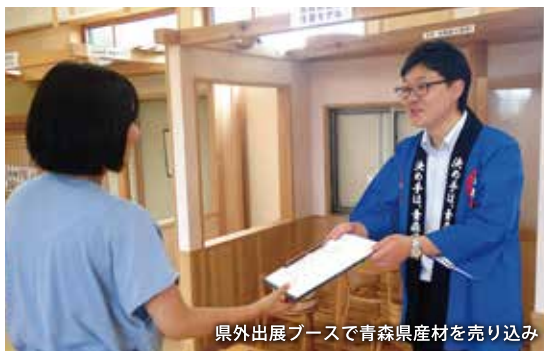
県外出展ブースで青森県産材を売り込み