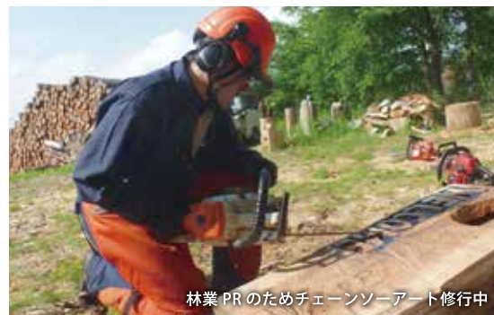
林業PRのためチェーンソーアート修行中