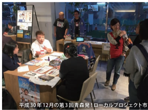
平成30年12月の第3回青森発！ローカルプロジェクト市

地域課題解決というとなじみませんが、「りんご箱」の新たな活用法の提案や、後継者不足