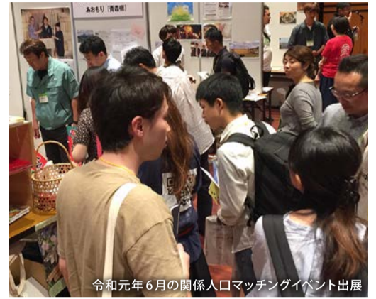
令和元年6月の関係人口マッチングイベント出展

からりんごの木が切られる状況を改善するための提案の募集など、楽しみながら関われる内容となっています。都市部の人に「青森って面白そう」と思ってもらえることが大事なんです。