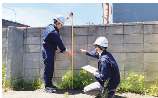
▲安全点検パトロールの様子

倒壊する危険性があります。県は年に2回、防災週間に合わせて地域のブロック塀の安全点検パトロールを行い、ブロック塀の所有者の皆さんへ安全点検を呼びかけています。