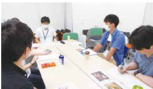
▲県内の大学生へのインタビューの様子

私は、若者の県内定着や還流を促進する業務に携わっています。本県においては、人口減少が進み、年間6千人を超える社会減に歯止めがかからず、特に10代から20代の若者の県外流出が大きな課題となっています。そのため、若者と、若者の将来選択に大きな影響を与える保護者世代に、青森の良さ、青森の新たな価値に気づいてもらえるよう、そして、一人でも多くの若者に、この青森で暮らしたい、青森で生きていきたいと思ってもらえるよう、次の取り組みを進めています。