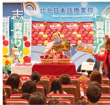
日本語を習う小学生・保護者に青森県産りんごの魅力をPR

2022年12月16日・17日に、青森県産りんごの輸出拡大を図るため、一般社団法人青森県りんご対策協議会の「青森りんごキャンペーン」と連携して、台湾で青森プロモーションを行いました。百貨店や量販店でステージイベントを開催し、青森県産りんごのおいしさや品質の高さをPRしたほか、行政機関や教育施設などを訪問し、交流を深めました。