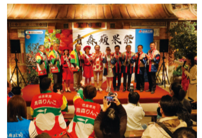
遠東百貨竹北店で「りんごフェア」を開催