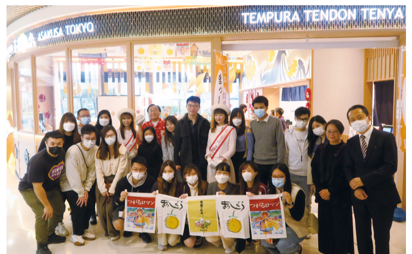
「天井てんや YOHOモール店」で知事らが青森県の食材をPR

2023年2月5日～7日の3日間にわたり、知事をトップに関係団体と連携し、香港各地で青森プロモーションを行いました。青森県産米「まっしぐら」をはじめとした青森県産品を使用している「天井てんや」において、青森県産米のPRイベントを実施し、青森県産品を使用した特別メニューを提供するなど県産農林水産品の魅力を発信しました。