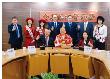
行政院衛生福利部食品藥物管理署(FDA)を表敬訪問

2022年12月16日・17日に、青森県産りんごの輸出拡大を図るため、一般社団法人青森県りんご対策協議会の「青森りんごキャンペーン」と連携して、台湾で青森プロモーションを行いました。百貨店や量販店でステージイベントを開催し、青森県産りんごのおいしさや品質の高さをPRしたほか、行政機関や教育施設などを訪問し、交流を深めました。