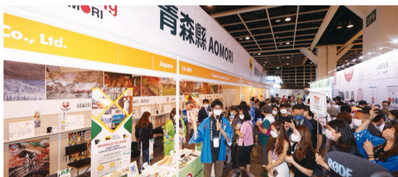
「香港フードエキスポ」に多くの香港市民が来場