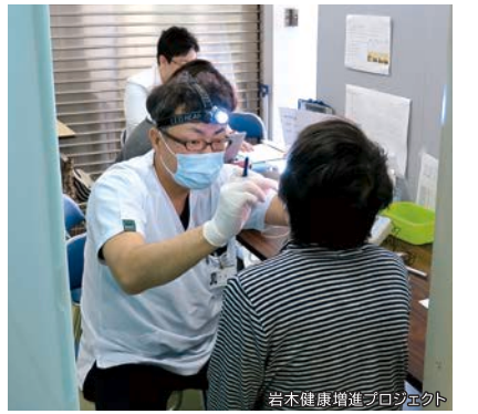
岩木健康増進プロジェクト

弘前市岩木地区で、「岩木健康増進プロジェクト」を行ってきました。1000人規模の健康調査から得られるデータを短命県返上に生かそうというもので、平成25年に文部科学省が推進する「COI(Center of innovation) STREAM」プログラム(※)の採択を受けました。