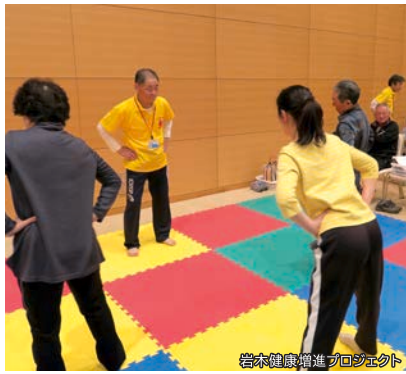
岩木健康増進プロジェクト