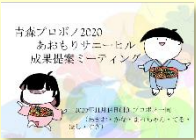
広報戦略の提案 オリジナルキャラクター制作