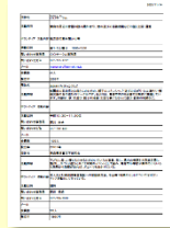
広報先リストの 提供