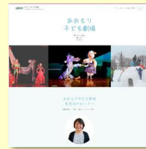
ホームページ 制作