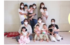
ママボノチーム による支援