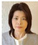
公益社団法人 日本広告審査機構 (JARO) 審査部

広告に関わる法律や、問題のある広告の具体的な事例を知り、広告を正しく読み取るポイントを学びます。