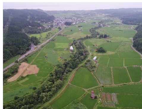
地区全景(ドローン撮影)

こうした課題を解決するべく、令和2年度から経営体育成基盤整備事業(ほ場整備事業)に取り組んでいます。