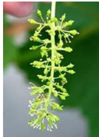
満開時のシャインマスカットの花穂

満開3～5日後（落花期）に、フルメット10ppmを加用したジベレリン25ppm溶液に花房浸漬する。