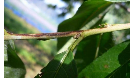
せん孔細菌病夏型枝病斑

一次伝染源である春型枝病斑の切除を徹底する。6～8月に新梢に発生する夏型枝病斑は重要な伝染源になるので、見つけ次第切り取り、適切に処分する。