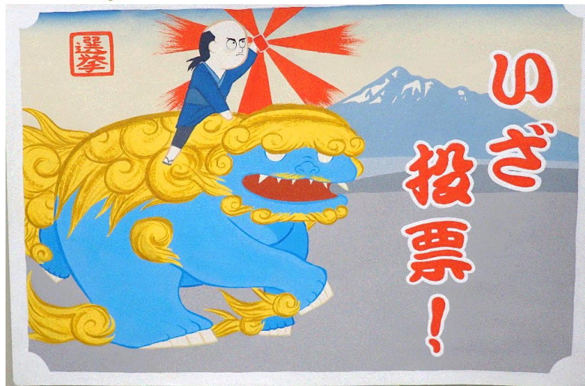
江良 美妃 つがる市立木造中学校(2年)