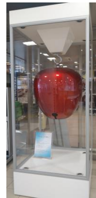
りんごの鈴(イメージ)

令和4年3月から新青森駅に展示されている「りんごの鈴」が、青森産直市の期間限定で上野駅にやってきます。真っ赤に輝くりんごの鈴を是非ご覧ください。