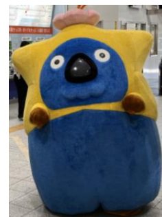
いくべえ(イメージ)