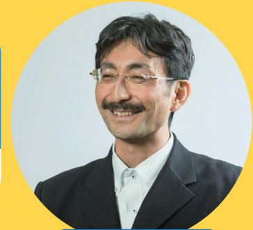
講師プロフィール

青森県出身。青森大学客員教授の他、(株)キャンサースキャン顧問、横浜市行動デザインチームアドバイザー、OZMA Nudge Social Design Unitアドバイザー、政府の日本版ナッジ・ユニットの有識者委員などを通じ、行政や企業のナッジ戦略を支援。ナッジを紹介したTEDxトークは、YouTubeで60万回以上再生されている。代表作は「DVD 実践者のナッジ」(東京法規出版)、「ナッジ×ヘルスリテラシー」(大修館書店:分担執筆)。