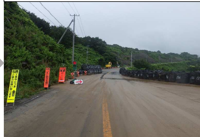
復旧状況 7月16日 15時時点