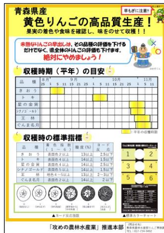
▲黄色りんごの適期収穫啓発チラシ