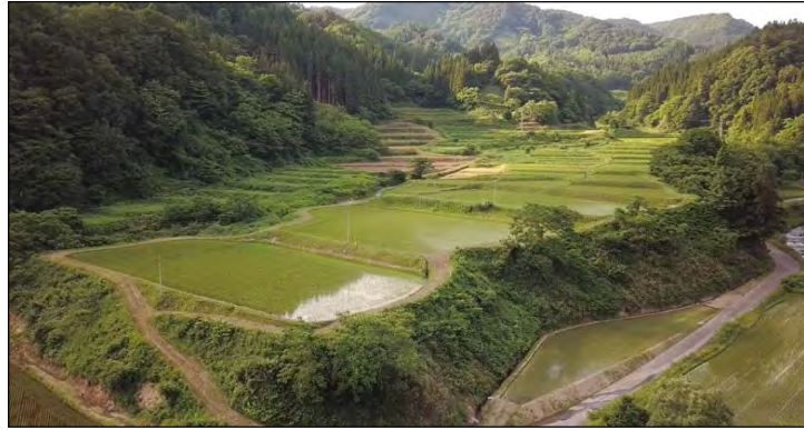
[大川原地区の棚田]