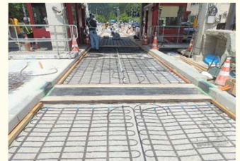
ロードヒーティング改修工事のイメージ

期間: 令和6年5月14日(火)10時 ~ 令和6年7月12日(金)15時まで (※終日通行止め) 区間: 下田百石IC ~ 三沢・十和田・下田IC 迂回路: 国道45号、県道八戸野辺地線、県道三沢十和田線