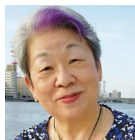
元消費者庁長官 (一社)消費者市民社会を つくる会 代表理事