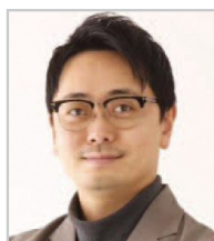
appcycle株式会社 代表取締役社長