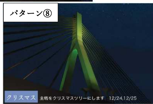
図-2 ライトアップイメージ（イベント時）