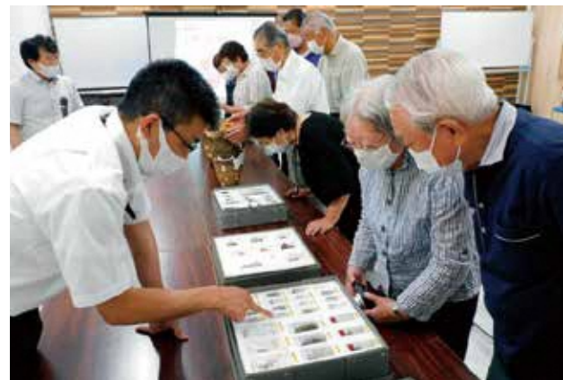
縄文の人々が食べていたものも間近に!!