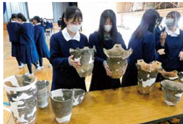
本物の土器に触って縄文を体感!!