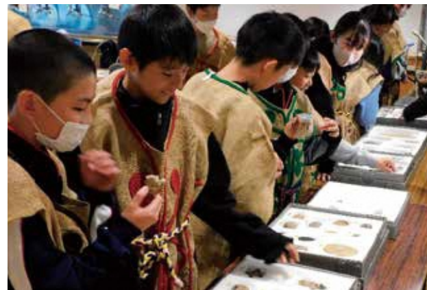
本物の土偶にも触れられる!!