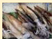
いか類漁獲量 日本一(R1)