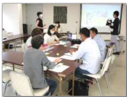
9月3日(土) 10:00~15:30 オリエンテーション キックオフミーティング