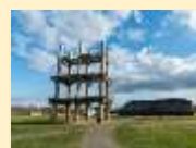
世界文化遺産 北海道・北東北の縄文遺跡群(R3) (三内丸山遺跡)