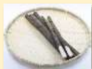
ごぼう収穫量日本一(R2)