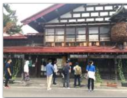
チーム活動 現地見学、定例のオンラインミーティング等