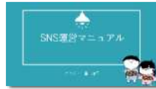
SNS運営マニュアル整備