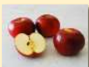
りんご収穫量日本一(R2)