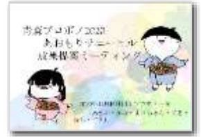
広報戦略の提案 オリジナルキャラクター制作