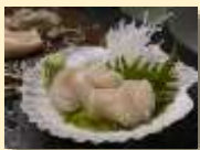
ほたてがい生産量 日本一(R1)