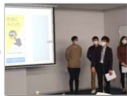
11月19日(土) 10:00~15:30 成果提案ミーティング 合同成果報告会