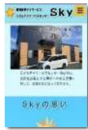
団体紹介ウェブサイト制作