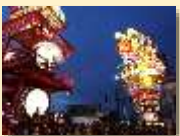
五所川原立佞武多