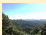
日本初・世界自然遺産 白神山地(H5)