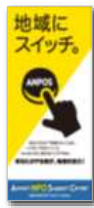
団体紹介パンフレット制作