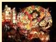
弘前ねぶたまつり