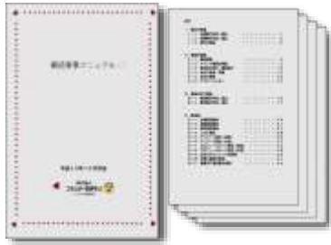
イベント運営マニュアル整備

平成30年度から令和3年度までの4年間に、県内外から94名のプロボノワーカーが参加し、県内19団体に支援を行いました。