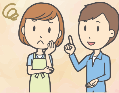
困り事についての相談相手