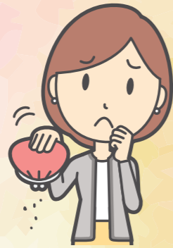
働き手を失った場合は経済的に困窮