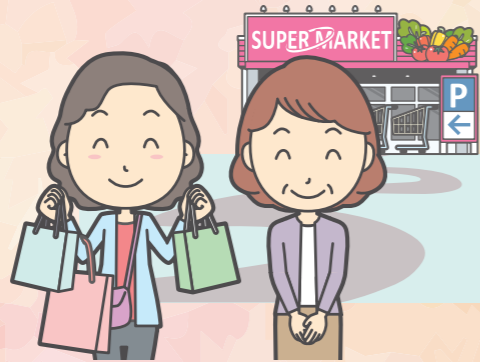
生活全般(買い物など)の手伝い