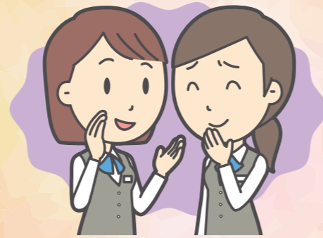
周囲の無責任なうわさ話や過剰取材によるストレス

この他、大けがをした場合は、医療費を負担しなければなりませんし、放火の場合などは、すぐに住む場所を探さなければなりません。また、精神的ショックなどで会社に行けなくなったり、周囲のうわさ話に耐えられずに転居を余儀なくされたりと、被害は多方面に広がります。