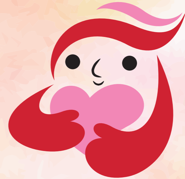
犯罪被害者等支援シンボルマーク 「ギュっとちゃん」

青森県犯罪被害者等支援条例は、犯罪等の被害に遭われた方やその御家族又は御遺族が受けた被害を早期に回復又は軽減し、安心して暮らすことができる社会の形成を目指して制定しました。