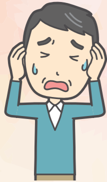
精神的ショックやそれに伴う体調不良