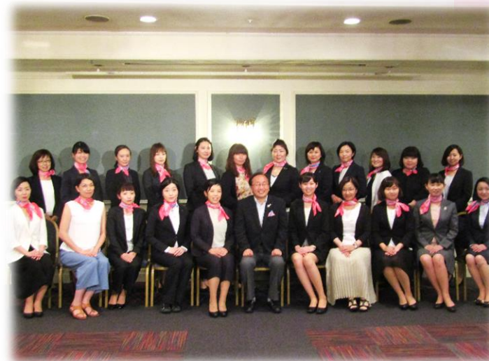
あおもり女子就活・定着サポーターズ結成式

(株)I・M・S、(株)青森銀行、(株)青森ダイハツモーターズ、青森レコードマネジメントサービス(株)、イマジン(株)、(株)NTTデータスマートソーシング、(株)大泉製作所、(社福)温和会、(株)木村食品工業、(株)コア、(株)小坂工務店、(株)東奥日報社、(社福)福祉の里、(株)福萬組、(株)ポーラ、(株)みちのく銀行、(株)ラメラボーテ、(株)フードコミュニケーション、マルマンコンピュータサービス(株) ※H31.6月時点