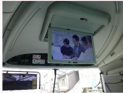
②バス社内でのDVD上映