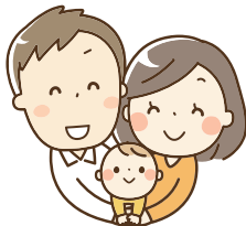
6歳未満の子どもがいる夫及び妻の家事・育児への参画時間

6歳未満の子どもがいる夫婦の家事・育児参画時間の調査によると、青森県では夫が妻の約6分の1程度で、全国的にも同じ傾向にあり、妻の負担が大きくなっています。