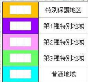
津軽国定公園区域図 (大間越付近)