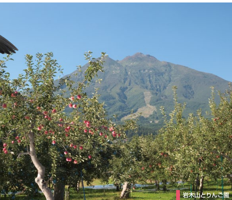
岩木山とりんご園