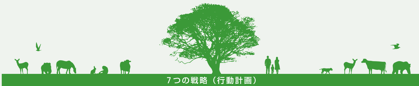
7つの戦略（行動計画）