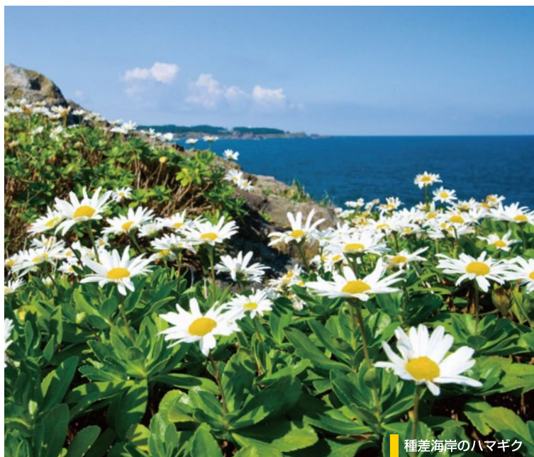
種差海岸のハマギク