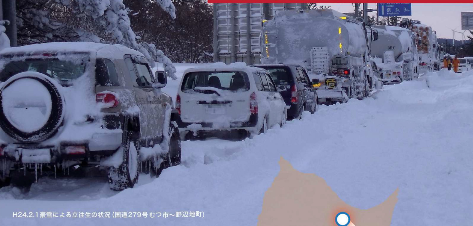
H24.2.1 豪雪による立往生の状況 (国道279号むつ市～野辺地町)