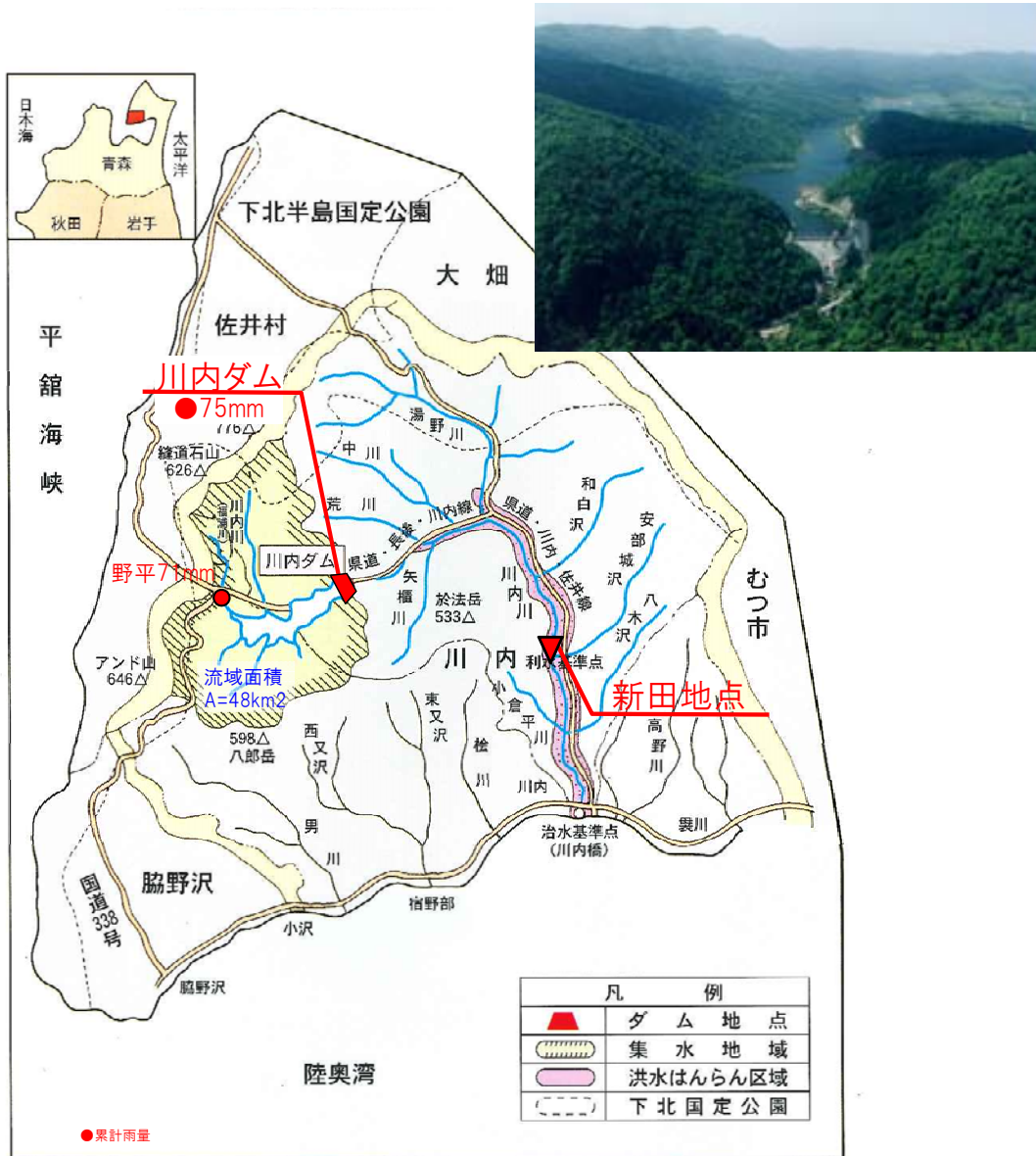
【川内ダム地点雨量】