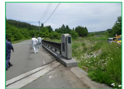
重要水防箇所等の合同巡視

※対策の代表箇所を旗揚げしている(全域で取組む対策は省略)。 ※「伐採・掘削」は該当河川的位置を旗揚げしている。 ※具体的な対策内容については、今後の調査・検討等により変更となる場合がある。