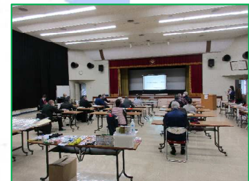
自主防災組織等を対象にした研修会