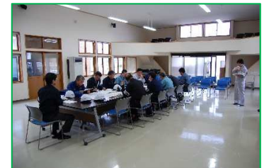
防災マップや洪水タイムラインを活用した避難訓練の実施