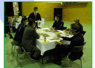
自主防災体験研修会