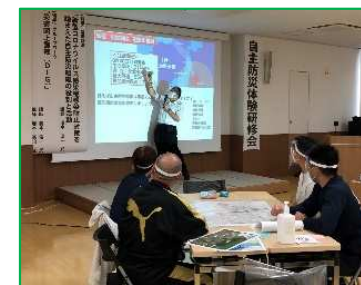
自主防災体験研修会