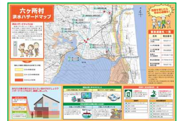
ハザードマップ作成