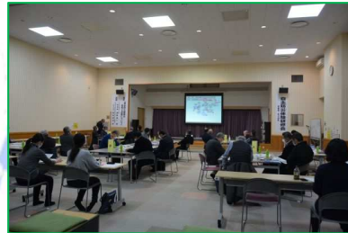
自治会長等を対象にした 自主防災体験研修会