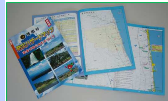
防災ハザードマップ