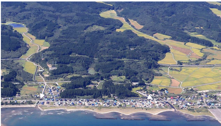
板木沢川(準用河川)