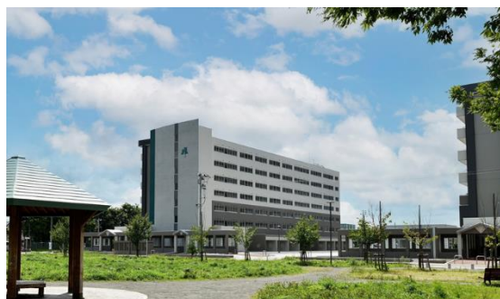
県営住宅小柳団地建替事業 (平成24～令和3年度)