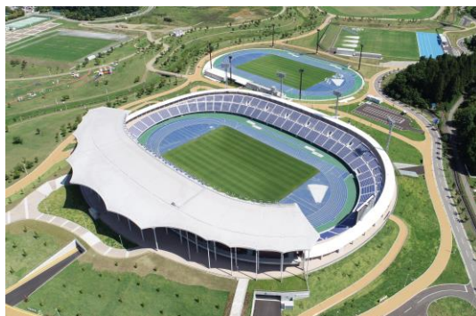
新青森県総合運動公園陸上競技場 (平成30年竣工)