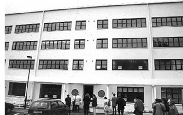
つぶれてしまった工場跡地