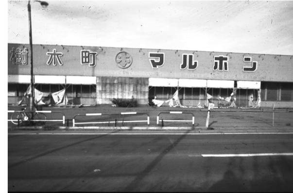
そのままにしておく弘前市役所が悪いと思う!