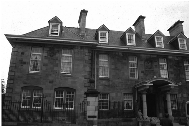
つぶれてしまった病院