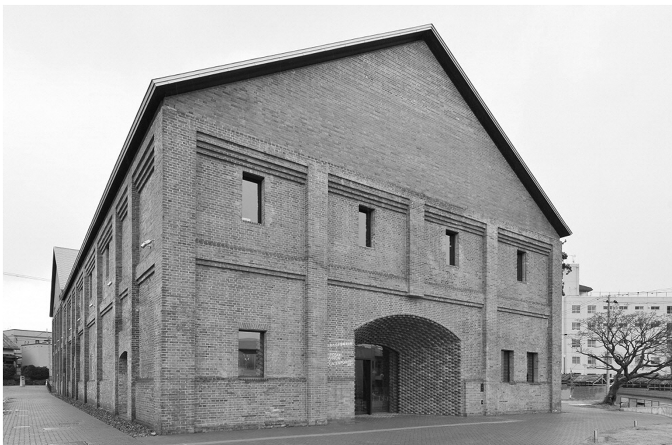
弘前れんが倉庫美術館(弘前市)