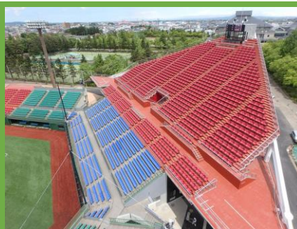
公共建築物部門 最優秀賞 「はるか夢球場（弘前市）」