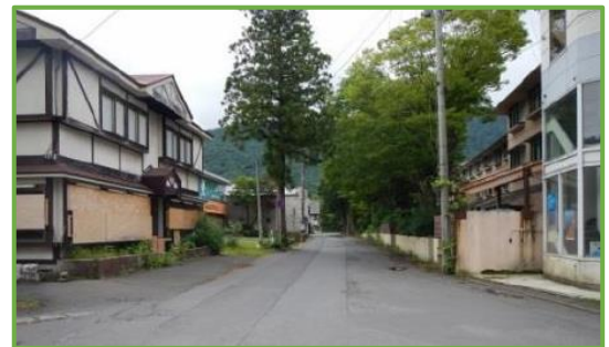
十和田市休屋地区

一方で、「国立公園満喫プロジェクト」に選定された十和田市休屋地区では、廃業した宿泊施設等の廃屋によって景観が悪化してきているといった状況です。