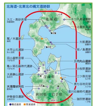
北海道・北東北の縄文遺跡群

既存の人工構造物をすべて排除することはできないという現状において、ICOMOSの審査をクリアできるような、全遺跡統一で具体的な景観規制の設定が課題となります。