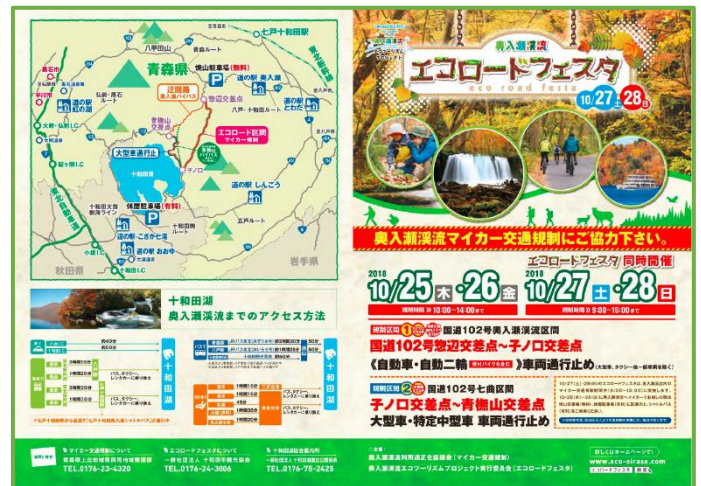
総合案内パンフレット

エコロードフェスタやマイカー交通規制はこの活動の一端として行われており、今年度は平成30年10月25日（木）～28日（日）の期間でマイカー規制が行われ、27日（土）及び28日（日）の2日間でエコロードフェスタが県道路課主催で開催されました。