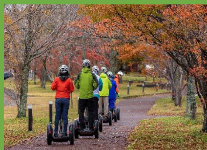
セグウェイガイドツアー