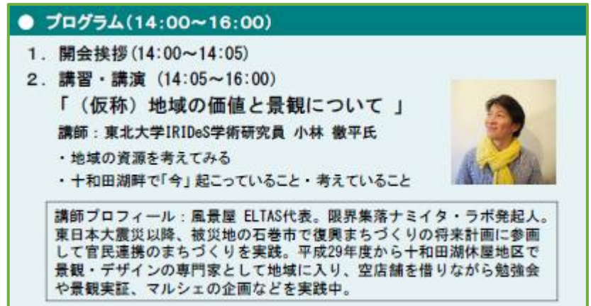
セミナープログラムと講師プロフィール

講演では、各自の馴染みある1つの風景を3つの視点（体験）から書き出すという演習も行われ、周りとの意見交換を通して、景観や観光の意識啓発が図られました。