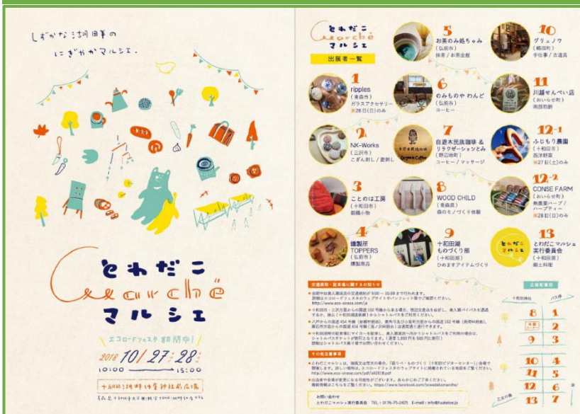
↑ 企画されたマルシェ