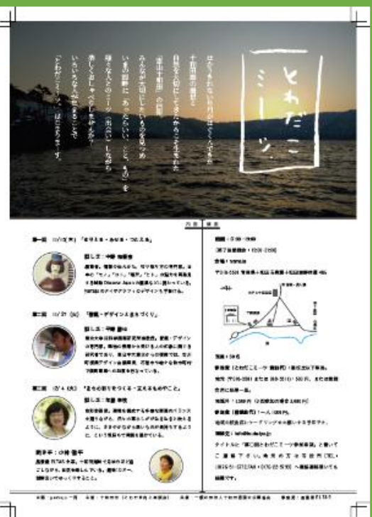
企画された勉強会 →