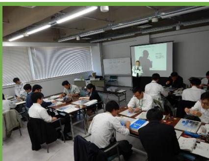
カラーシステム演習の様子