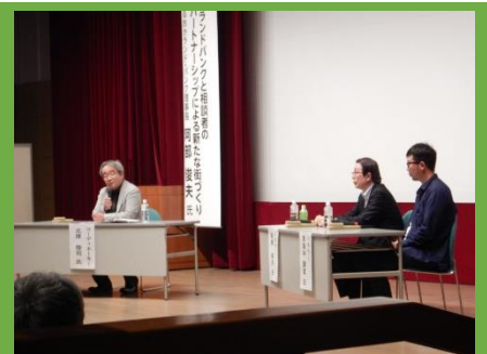
パネルディスカッション 「空き家・空き地の景観を元気にする ために」