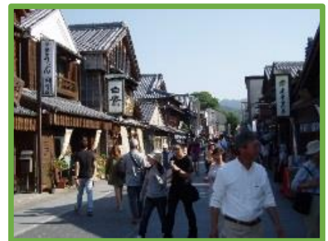
景観規制と景観まちづくり組織による 再生事例（三重県伊勢市）

本事業はH31, H32の2ヶ年計画となっており、「住んでよし、訪れてよし」の観光地域づくりの実現や、景観に配慮した空き家・空き地の再生を実現する持続可能な仕組みの確立を課題としています。