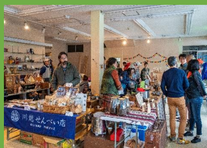
十和田湖マルシェ