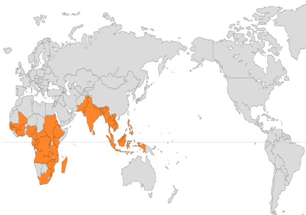
図 チクングニア熱報告症例の分布 (1952-2006年)

平成23年2月1日よりチクングニア熱が四類全数把握対象疾患に加わりました。本感染症の原因病原体は、トガウイルス科アルファウイルス属チクングニアウイルスであり、蚊の媒介により感染します。近年、 東南アジア地域(スリランカ、タイ、マレーシア、シンガポール、インドネシア、インド等) で患者数が増加し流行地域が拡大していることが報告されています(左図)。2006年以降日本国内においても帰国者17人の輸入症例が報告されています。主な症状は2~12日の潜伏期間の後、突然の発熱、激しい頭痛、関節痛、筋肉痛、発疹等です。関節痛は急性症状消失後も数か月続くことが多いとされています。現在、ワクチン等の予防接種はなく感染予防は、デング熱やウエストナイル熱と同様蚊に刺されないことです。