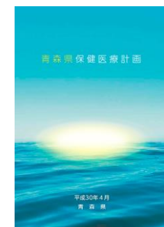
青森県保健医療計画