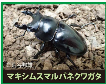
マキシムスマルバネクワガタ