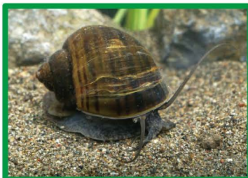
スクミリンゴガイ