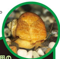
かんしょう用の ゴールデンアップルスネール

つかまえても、他の場所に持って行かないでね。飼っている貝は、池や川に放さないでね。