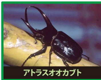
アトラスオオカブト