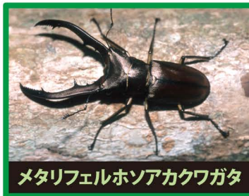
メタリフェルホンアカクワガタ

野外に出ると、日本のカブトムシやクワガタの餌やすみかをうばったり、交雑したり、昆虫の病気を広めます。