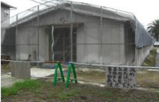
鶏舎全体を防鳥ネットで覆った事例 (ファスナー開閉による入退出)