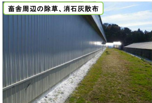
畜舎周辺の除草、消石灰散布