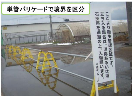
単管バリケードで境界を区分