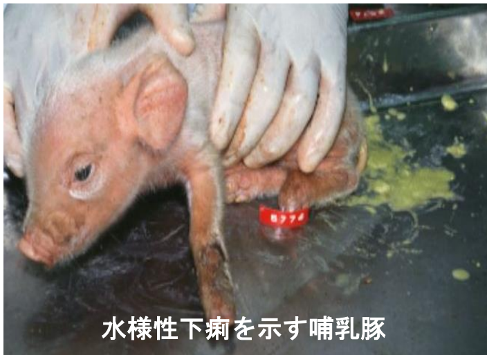
水様性下痢を示す哺乳豚